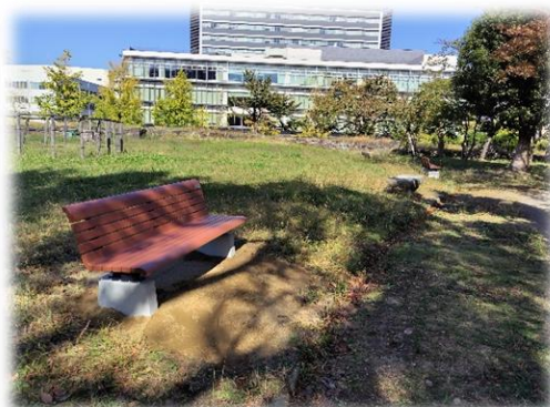
[二の丸広場ベンチ]