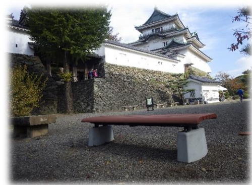
[天守閣前広場ベンチ]