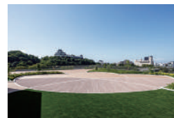
和歌山城会馆的屋顶露台是 和歌山城的最佳摄影景点。