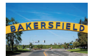
贝克斯菲尔德 (美国)