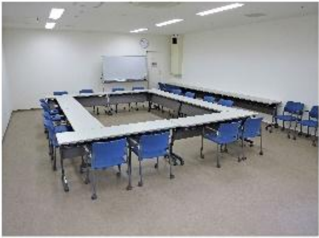
ミーティングルーム A 約45㎡、定員20人