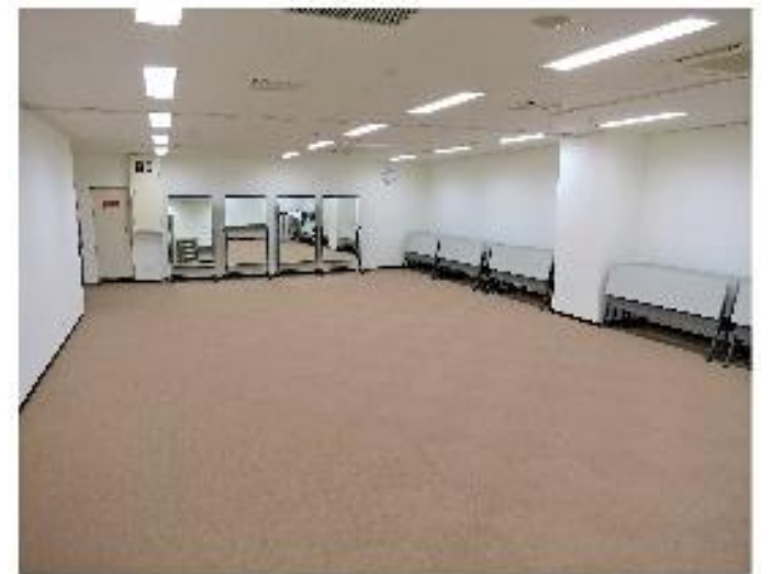
ミーティングルーム C 約117㎡、定員60人

輪転機 白黒印刷ができます。USBメモリでお持ちいただいたデータの印刷も可能です。 (注) 印刷用紙は持参してください。 1原稿の印刷枚数が20枚以上からご利用できます。