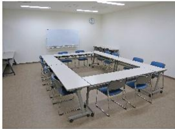
ミーティングルーム B 約71㎡、定員30人