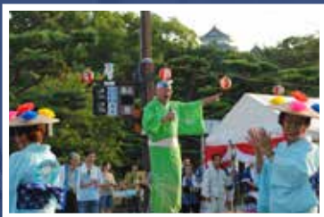
長年、多くの市民が聞きなれ親しんだ「歌声」を生で披露。おどりを盛り上げてくれました。