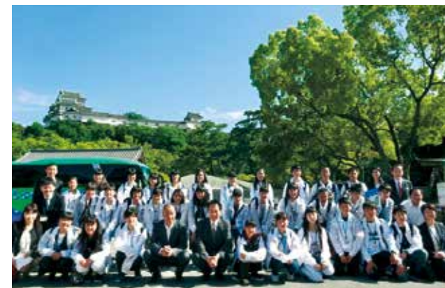
出発前に記念撮影。5月21日までの10日間、カナダで親善を深めます。