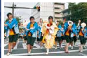
アップテンポのニューバージョン「ぶんだら21」。出場連のみなさんも特徴のある衣装で登場です。