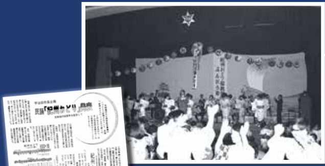
↑昭和44年4月24日市民会館大ホールで初めて「紀州おどり ぶんだら節」がお披露目されました。 ←市報わかやま(昭和44年2月号 No.228)に掲載された紹介記事。