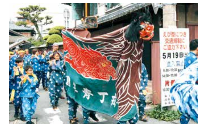
掛け声をかけ、神輿を担ぎながら巡行する人たち。