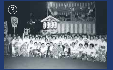
第2回～5回頃のぶんだら節の様子