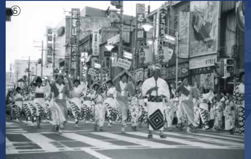
①けやき大通り ②砂の丸にて輪踊り ③やぐら前で出場連が記念写真 ④⑤プラクリ丁前