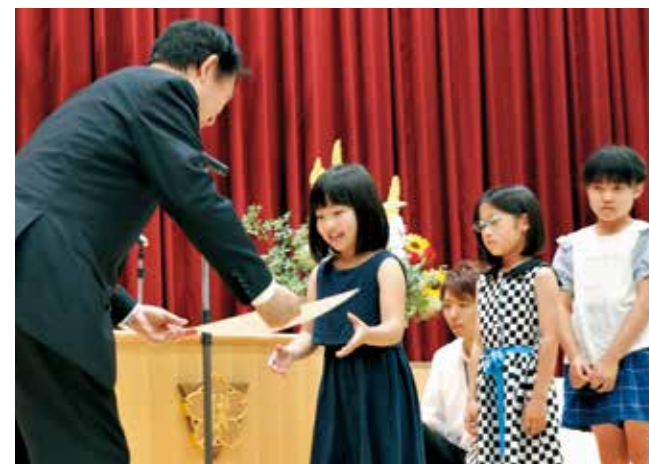
笑顔で表彰状を受け取る児童たち。

6月4日から10日までの歯と口の健康週間にあたり、「歯と口の健康週間に係わる表彰式」が、伏虎義務教育学校で行われました。今回の表彰式では、「良い歯の児童」、「良い歯の学校」、「ポスター」、「標語」、「詩」の5部門、計130人の児童と5校の学校が表彰されました。名前を呼ばれた児童たちは、少し緊張しながらも笑顔で表彰状を受け取っていました。