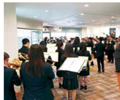
市立和歌山高校の吹奏楽部のみなさんによる音楽演奏がオープニングを盛り上げてくれました。

平成31年4月には本町小学校跡地に和歌山信愛大学が開学し、昨年4月に開学した東京医療保健大学和歌山看護学部とともにまちなかに学生さんの姿が増えています。これまで中心市街地の活性化に取り組んでこられた和歌山大学のみならずをはじめ、NPOや地域で活動される方々、またリノベーションなどでまちづくりに関わってきた方々、新たにまちなかで学ぶ学生さんなど、いろいろな人たちがつながる場所です。 地域フロンティアセンターにはチームフロンティア（自治振興課職員）がいます。チームフロンティアは、地域フロンティアセンターを飛び出し、学生さんとうながりたい地域の方々、そして地域で活動したい学生さんの声を拾い、相互交流を図っていきます。 また、この地域フロンティアセンターにはフリースペースを設けています。いろんな世代、所属の方々が交わるスペースとして、赤ちゃんをお散歩途中のお母さん、放課後や長期休暇を友達と過ごす小学生など、基本はどなたでもご利用いただけます。異なる立場の方と出会うことで新しいつながりができ、皆さんの活動の幅が広がることを願っています。 地域フロンティアセンターは、そんな皆さんとともに歩み、地域の活性化を目指していきます。