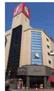
フォルテワジマ6階