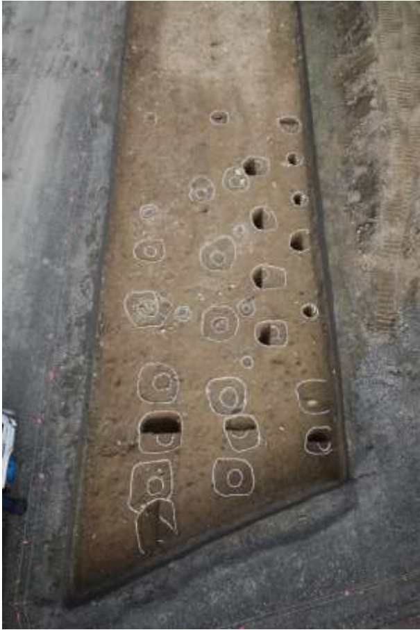
見つかった古代の建物（南から）