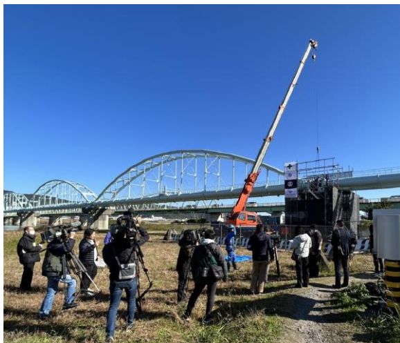
六十谷水管橋への設置工事の様子