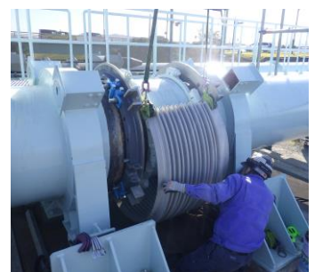
漏水防止カバーの設置工事