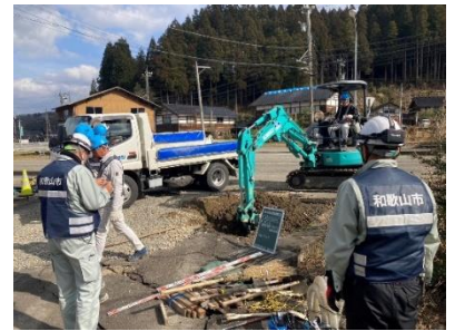
能登町での応急復旧支援