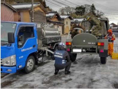
穴水町での応急給水支援

和歌山市管工事業協同組合と協力して、水道管路の漏水調査、漏水修繕などの応急復旧支援を実施