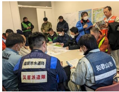
能登町でのリーダー都市としての支援