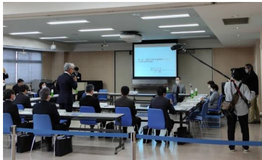
新水道事業ビジョン水道料金検討会議を公開にて開催

令和5年度は、検討会議の委員の皆様と「①適正な料金水準、②水道料金算定の仕組み、③料金体系見直しの方向性」について、議論しました。