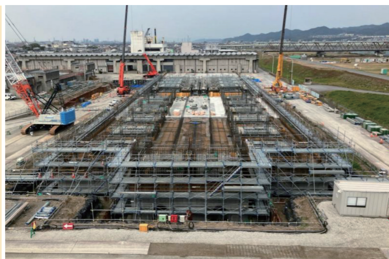
加納浄水場 ろ過池混和池築造工事状況

現在は、取水施設の耐震補強工事、ろ過池混和池築造工事などを行っています。加納浄水場は限られた敷地内において、運転を継続しながら施設の工事を行っているため、全ての施設の更新完了予定は令和20年度(2038年度)になっています。