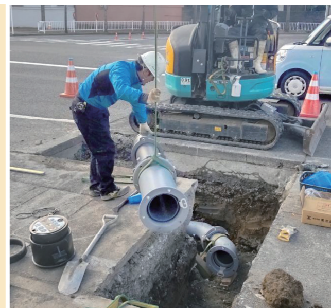
水道管の更新工事状況