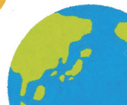
人工衛星で画像を撮影