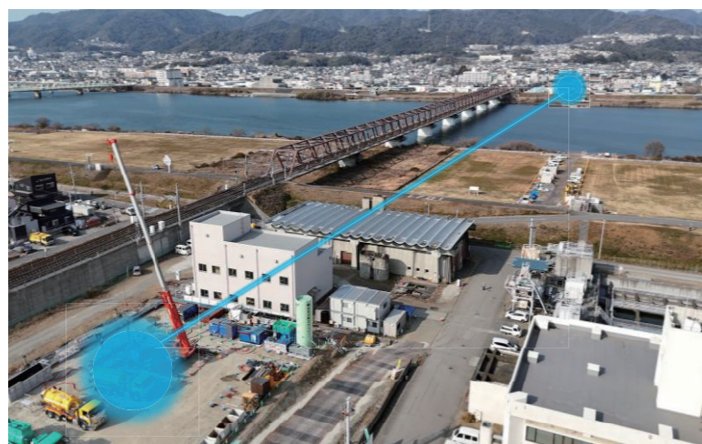
加納浄水場から紀の川北部地域への送水管布設ルートイメージ図

六十谷水管橋のみに頼っていた紀の川北部地域への水道水を安定供給するため、送水管の複線化事業に取り組んでいます。