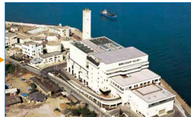
青岸エネルギーセンター