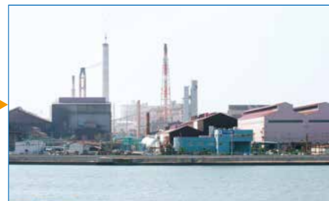
日本製鉄関西製鉄所和歌山地区

●先生方へ● 工業用水道の用途として、日本製鉄(株)関西製鉄所和歌山地区では溶鉱炉の冷却水に、花王(株)和歌山工場では製造プラントの冷却水、また青岸エネルギーセンター、クリーンセンターでは焼却炉の熱で工業用水を蒸気にして、発電機を動かし、電力を発生させるために用いられます。