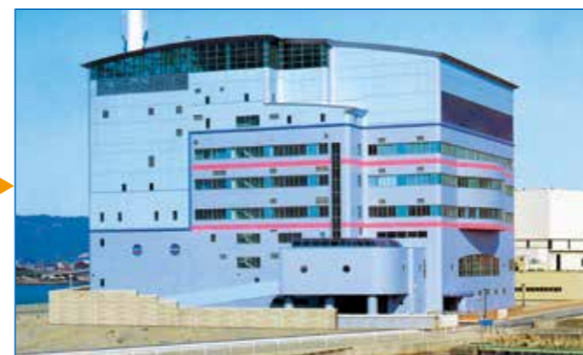
青岸クリーンセンター