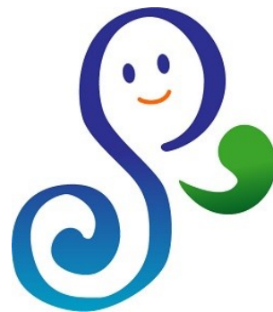
海ネットのシンボルマーク

瀬戸内海沿岸の市町村、府県及び国の機関で構成されている「瀬戸内・海の路ネットワーク推進協議会」の骨格事業として、海岸の清掃活動という“誰もが参加しやすい活動”を通じて“美しい瀬戸内を守っていく”こと目標に取り組んでいる事業です。