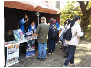
①観光PRブースの設置

平成28年の徳川吉宗將軍就任300周年と港区政70周年を契機に交流を深めています。 当日は、港区から武井区長様、赤坂氷川神社から恵川禰宜様がお越しになられます。