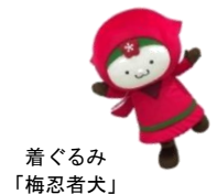
着ぐるみ「梅忍者犬」