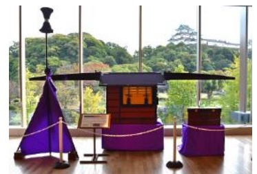
⑦大名駕籠（だいまようかご）の展示