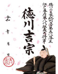
②「徳川吉宗公武将印」イメージ