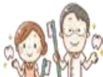
프로페셔널케어 치과 의원에서 실시하는 치아 예방 처치