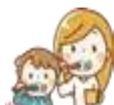
셀프케어 자신이 매일하는 양치