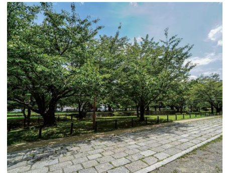
令和4年8月 順調に萌芽し青々と茂る桜の木