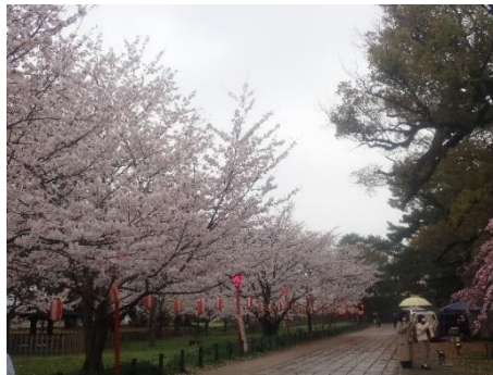
令和4年4月 満開の桜