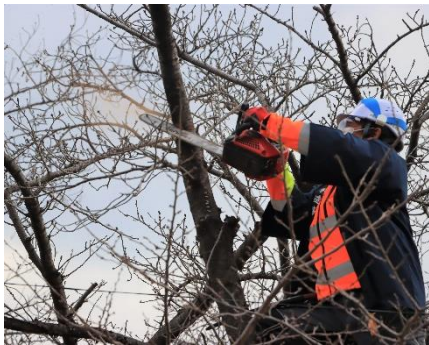
令和4年2月 治療剪定

今年は、協会創立50周年の節目の年であることから、昨年度実施箇所の追加剪定等に加え、二の丸広場まで範囲を広げて昨年以上の規模で実施していただく予定です。