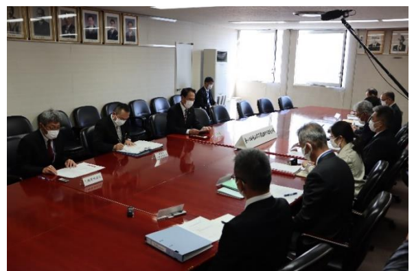
第1回策定会議（令和4年11月15日開催）