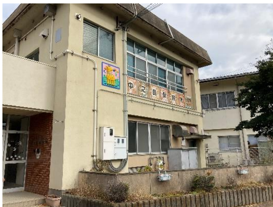
旧中之島保育所の現況写真