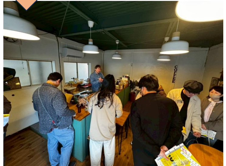
商店街のお店で食事や買い物