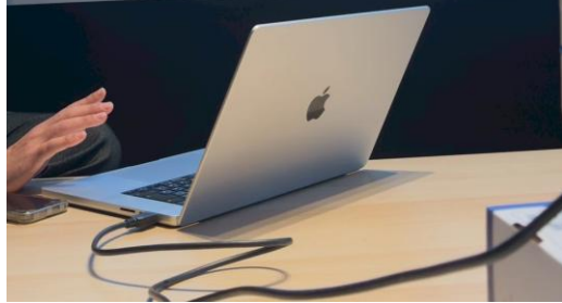
北ぶらくり丁の まちづくりの説明