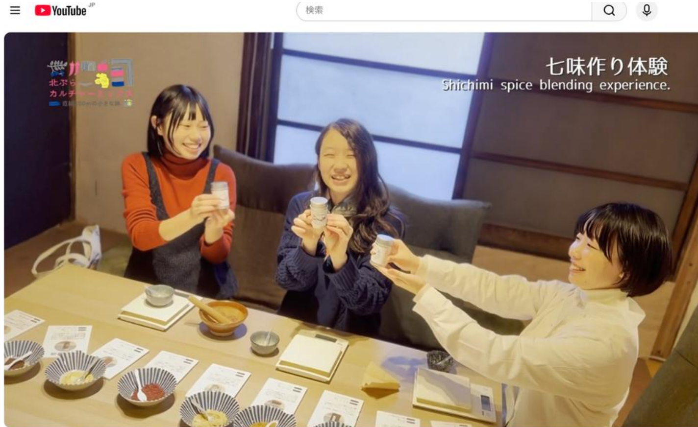
北ぶらカルチャーミックス "Kitabura Culture Mix Tour" 直線200mの小さな旅 "200-Meter Journey"