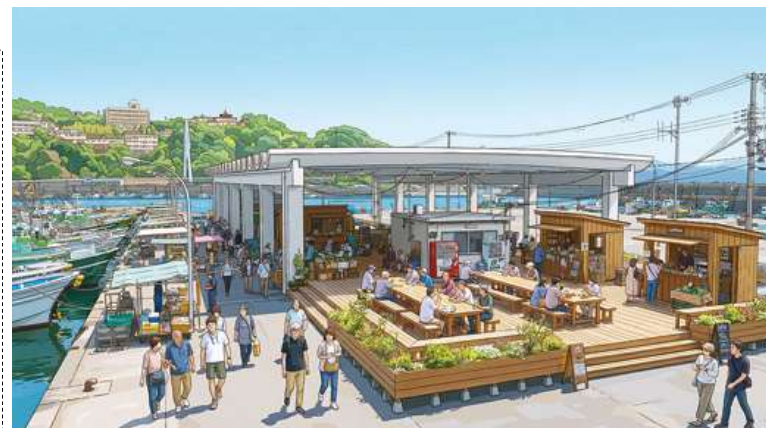
雑賀崎漁港の船上販売を核としたコンテンツ（イメージ）