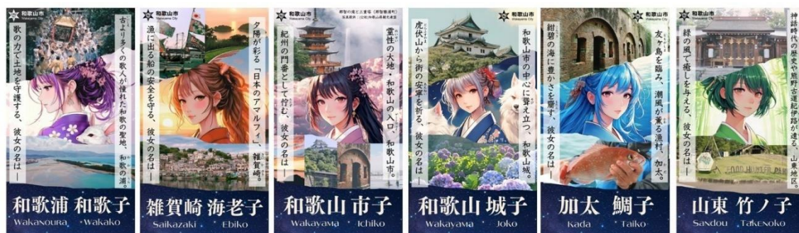
(制作された擬人化キャラクター広告)

和歌山市では、令和7年4月に和歌山市の特徴ある各地域等を擬人化した6種類の広告を制作し、新大阪駅新幹線改札内デジタルサイネージ等への掲出やPRカードの配布を行ってきました。