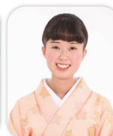
桂 米舞 師