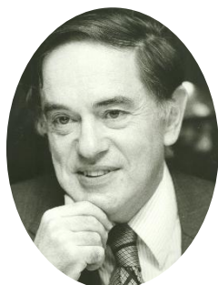
ドナルド・キーン氏

文化的風土の醸成と本市出身の作家有吉佐和子の顕彰を目的に、有吉佐和子と交流のあった日本文学者・ドナルド・キーン氏のご子息・キーン誠己氏を招いた講演と、ドナルド・キーン氏と有吉佐和子の交流や功績が日本の文学界にどういった影響を与えたかなどについてのパネルディスカッション、有吉佐和子のお著「青い壺」の朗読を行います。