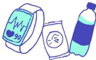
ウェアラブル端末、 応急セット