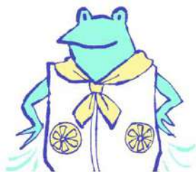
ファン付きウェア、 ネッククーラー