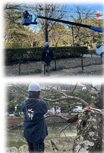
【昨年の作業の様子】