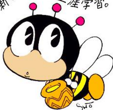
生涯学習のマスコット “マナビィ”