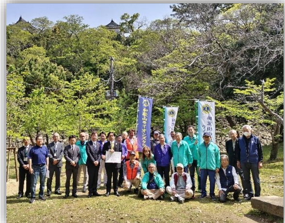
去年のセレモニーの様子