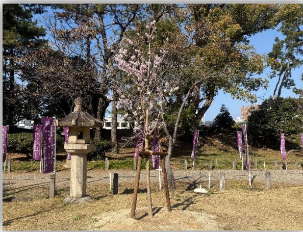
過去に植樹いただいた桜の開花状況 (3月24日撮影)

和歌山市内3つのライオンズクラブ様主催のアースデーセレモニーにおいて、感謝状の贈呈を行います。