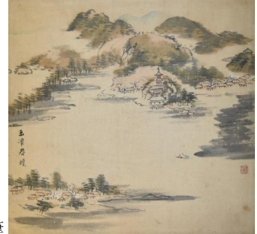
明光浦十景図のうち玉島春暁 岡本緑邨筆

和歌の浦周辺の代表的な10の場所をとりあげた明光浦十景図は、絵の題材として親しまれました。また、和歌の浦一帯を絵と文で紹介する和歌浦之賦図巻はくり返し写され、人気の高さがうかがえます。このほかに、江戸時代の終わりから近現代にかけて描かれた和歌浦図を展示します。