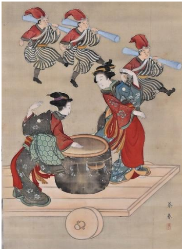
和歌祭（餅搗踊）図 野際蔡春筆

明治時代以降、紀州藩が主体であった江戸時代とは異なり、和歌祭は徳盛社や明光会といった新たな組織や和歌の浦の人々の寄付金によって運営されるようになりました。しかし、運営資金の問題から次第に例年開催が困難となり、昭和期になると、戦争を背景に和歌祭は途絶えま