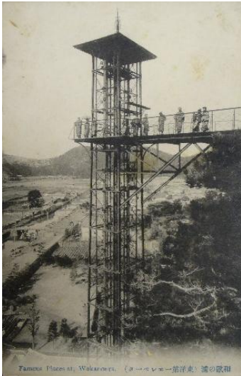
〔絵葉書〕 奠供山エレベーター