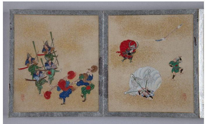
和歌祭図 榎本遊谷筆

日本遺産にも認定されている名勝・和歌の浦は、神亀元(724)年に聖武天皇が行幸して以来景勝地として知られ、今日に至るまで多くの人々に親しまれてきました。そのうつりかわりの中で、とりわけ近代には、新和歌浦の開発によって新たな観光名所が創出されるなど大きな変化が生まれました。また、東照宮の祭礼である和歌祭も、運営や練物などを中心として民衆の主導になるなどの変化がありました。