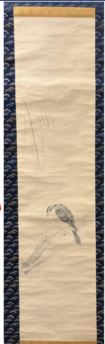
伝 徳川光貞 画「鷹図」 (南嶽山 禅林寺蔵)