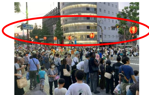
①けやき大通り設置箇所