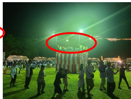
②西の丸広場やぐら上部