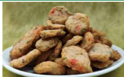
揚げかまぼこ 協賛 (和歌濱かまぼこ)